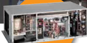
Liebert Mini-Mate™ 2