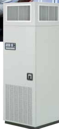
Liebert Challenger™ 3000